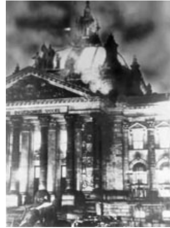
Figuur 1: De vermeende communist Marinus van der Lubbe zet op 27 februari 1933 de plenaire zaal van de Reichstag in brand. Hitler's staatsterreur, als antwoord op deze aanslag, neemt aanvang.

Op 27 februari 1933, enkele weken na de machtsovername door Adolf Hitler, brandde de plenaire zaal van het Reichstag-gebouw volledig uit. De Nederlander Marinus van der Lubbe werd ter plekke gearresteerd en na een discutabel 'openbaar proces' geëxecuteerd. Nergens is zoveel over gespeculeerd als over het motief achter dit misdrijf. Het verhaal gaat dat Van der Lubbe als communistisch activist een revolutionair verzet tegen het nazisme wilde losmaken bij de arbeidersklasse. In een andere these wordt gesteld dat juist de nazi's hem hebben aangezet om de Reichstag in brand te steken. 1 Wat het motief ook was, Hitler verklaarde dat God hiermee het teken gaf om de communisten met ijzeren vuist te vernietigen. Een golf van staatsterreur rolde over Duitsland. Duizenden communisten, sociaal-democraten en andere tegenstanders van het nationaal-socialisme werden gearresteerd. Vanwege de noodtoestand kon Hitler, conform artikel 48 van de Grondwet, de burgerlijke vrijheidsrechten 'opschorten'. De brand was helaas niet het sein tot de opstand van de arbeidersklasse, maar een incident dat Hitler op slimme wijze hanteerde om zijn macht verder te consolideren.