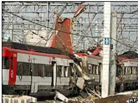
Figuur 6: In een videoband eiste de militaire woordvoerder van Al-Qaeda, Abu Duham al Afghani, de aanslagen op namens zijn terreurnetwerk: "Het is een antwoord op jullie samenwerking met de criminelen Bush en zijn bondgenoten. Dit is hoe geantwoord wordt op de misdaden die jullie hebben veroorzaakt in de wereld, en specifiek in Irak en Afghanistan, en er zal meer zijn, als God dat wil. Als jullie je onrecht niet stoppen, zullen er meer en meer dreigingen zijn. Deze aanvallen zijn klein vergeleken met wat zal gebeuren met wat jullie terrorisme noemen".

De geloofsstrijders van de Jihad, de 'heilige oorlog', zijn militair bijna niet te treffen zonder dat daarbij veel onschuldige slachtoffers vallen. De radicale moslimbeweging is een niet-statelijke vijand die mondiaal opereert in een netwerk van kleine cellen. Toch greep Washington naar militaire middelen, zoals conventionele oorlogsvoering, in de strijd tegen het terrorisme. Juist deze strijd haalde Bush aan om de inval in Irak te rechtvaardigen. Een direct verband tussen Irak en het islamitische terrorisme is nooit aangetoond en werd vaak als tegenargument door critici gebruikt. Wel is de staatsterreur onder het schrikbewind van Saddam Hussein met de aanval op Irak de kop ingedrukt, maar de aanwezigheid van militaire troepen in Irak was voor Jihad-strijders op hun beurt weer een voedingsbodem voor nieuwe terreurdaden, zoals de aanslag in Madrid.