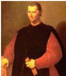
Figuur 5: Niccolò Machiavelli

Burke's politieke theorie, die sindsdien doorgaat als het 'conservatisme', staat in schril contrast met de opvattingen van de Florentijnse staatsman en historicus Niccolò Machiavelli (1469-1527). Machiavelli stelt in zijn verhandeling 'Il Principe (De heerser)' dat de vorst voor alles dient te streven naar macht en boven elke moraal staat. Volgens Machiavelli is macht een doel, waarvoor alle middelen geheiligd zijn, inclusief moord en verraad. Een absolute monarchie was wat deze filosoof voorstond. Niet of gedragingen van heersers goed waren en pasten in de door God bedoelde orde, maar of zij in het praktische leven succesvol waren, was zijn maatstaf. 6