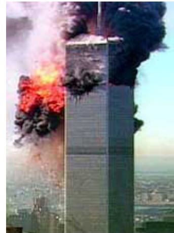
Figuur 2: Moslimstrijders van Al-Qaeda boren met gekaapte vliegtuigen, op 11 september 2001, de Twin Towers in. Bush start 'War on Terrorisme'.

Op 11 september 2001, negen maanden na de inauguratie van George W. Bush als 43 e president, werd Amerika getroffen door aanslagen op het Pentagon en het World Trade Center. Richard Clarke, ex-adviseur van Bush op het gebied van terreurbestrijding, verklaarde in een getuigenis voor de 9/11-Commission: "Bush repte al kort na de aanslagen over een aanval op Irak, terwijl er helemaal geen bewijzen waren dat Bagdad iets met de terreurdaden van doen had". 2 Volgens onderzoeksjournalist Bob Woodward zou vooral minister van Buitenlandse Zaken Powell de dadendrang van vice-president Cheney en Bush hebben gepoogd af te remmen, maar zonder succes. Bush zou zo geobsedeerd zijn van een oorlog tegen Irak dat hij alles aangreep, ook onbetrouwbare informatie van inlichtingendiensten, om een verband te kunnen leggen tussen Al-Qaeda en Irak. 3 Volgens Clarke, die er het boek Against All Enemies over schreef, was direct al duidelijk dat Al-Qaeda erachter zat en dat een aanval op Afghanistan als 'thuishaven' van het terreurnetwerk voor de hand lag. 4